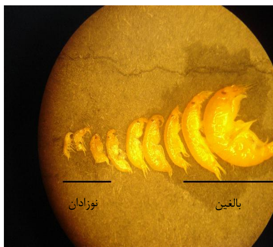
شکل ۱. اندازه‌های مختلف گاماروس پرورشی